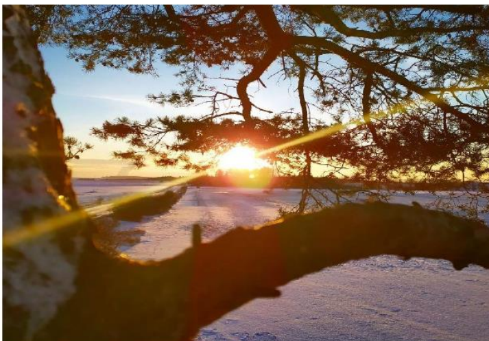
Zima v Březnici, autor: Jiří Valeš