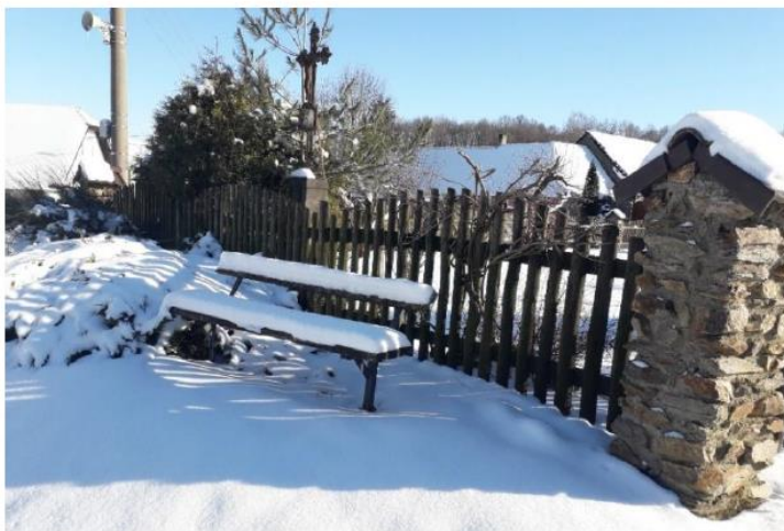
Zima v Jamniku, autor: Hruška Pavel