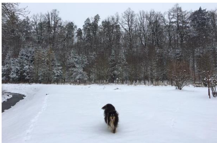
Zima v Březnici, autorka: Kateřina Moravcová