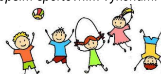
Holky z Rozcvičky

Přestože se někdy může zdát, že děti trénují spíše nás, pro nás je nejdůležitější, že je to baví, a že je za týden uvidíme znovu. Moc se těšíme na jaro, kdy budeme moci být venku a využívat výhod a prostor fotbalového hřiště k lepším sportovním výkonům.